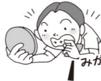
みがき残しをチェック