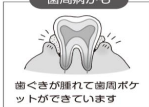
歯ぐきが腫れて歯周ポケットができています