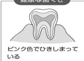
ピンク色でひきしまっている